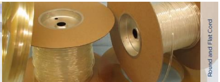
Round and Flat Cord