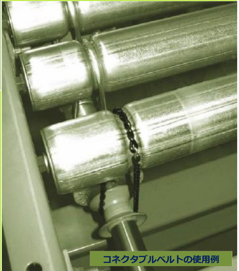
コネクタブルベルトの使用例

この材質は FDA の承認を受けており、さまざまな温度環境下での使用に適し、対薬品性にも優れています。