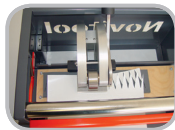
手動打抜き - 片手で操作