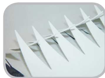
正確なフィンガー打抜き